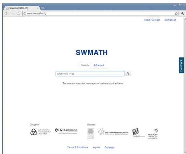
Abbildung 1: Auf der Startseite von swMATH befinden sich eine "Simple Search" und eine "Advanced Search" zur Suche nach Software.

swMATH ist ein neuartiger Informationsdienst für mathematische Software. swMATH bietet dem Nutzer nicht nur Zugriff auf eine umfangreiche Datenbank mit Informationen zu mathematischer Software, sondern umfasst auch eine systematische Verknüpfung von Softwarepaketen mit relevanten mathematischen Publikationen.